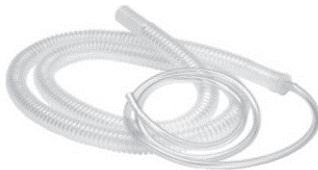
製品名: リープ用チュービングセット 長さ: 3.05m 未滅菌品