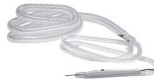
ペンシル組み立て例