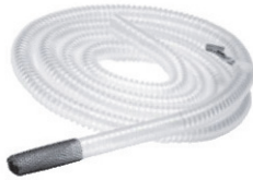
* 製品名: ハンドヘルドチュービングセット 長さ: 3.05m 滅菌品