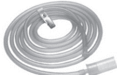
製品名: ラパロ用チュービングセット 長さ: 3.05m 滅菌品