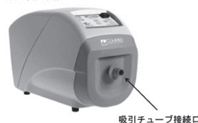
吸引チューブ接続口