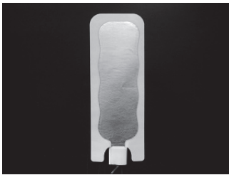
型番: 400-2100 大人用