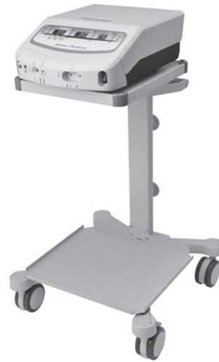
セーバージェネシス